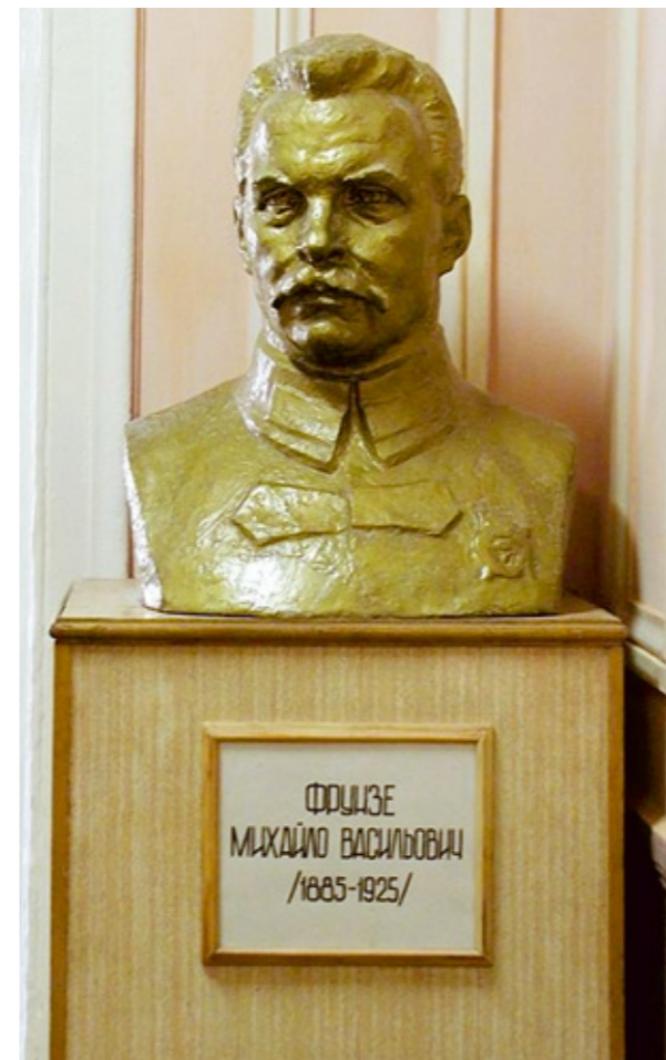
Бюст из клуба училища.