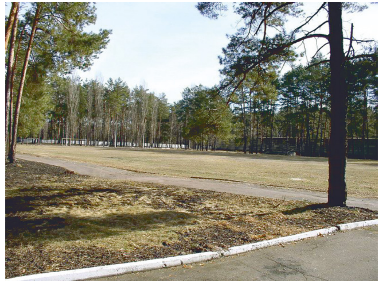
Сверху - футбольное поле. Снизу - на переднем плане виден плац с трибуной, в глубине - спортивный городок.