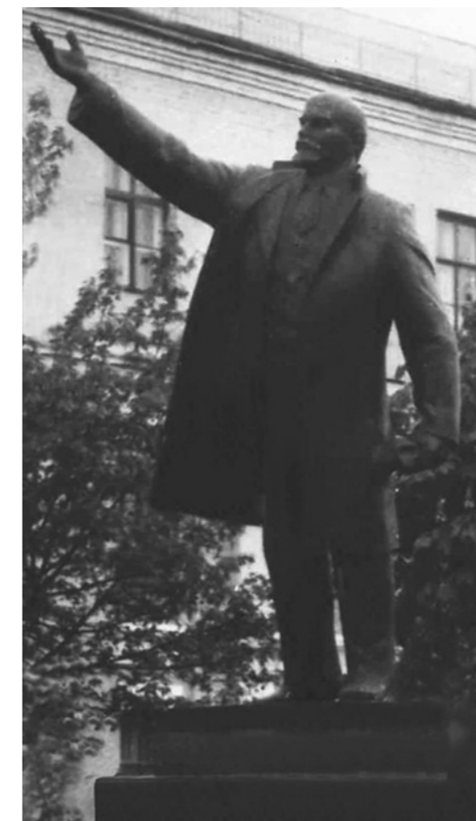
Памятник В.И. Ленину в училище.