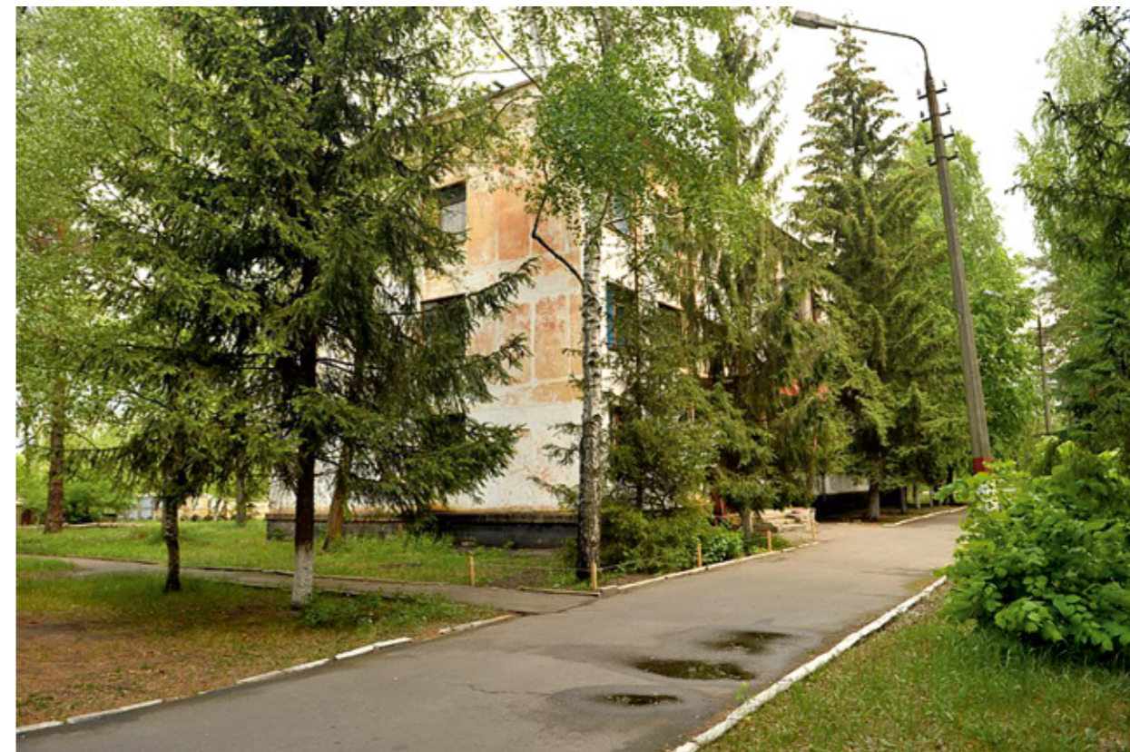
Сверху - офицерское общежитие. Снизу - учебный корпус с классами.