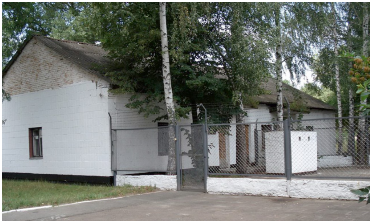
Сверху - караульное помещение. Снизу - парк боевых машин.