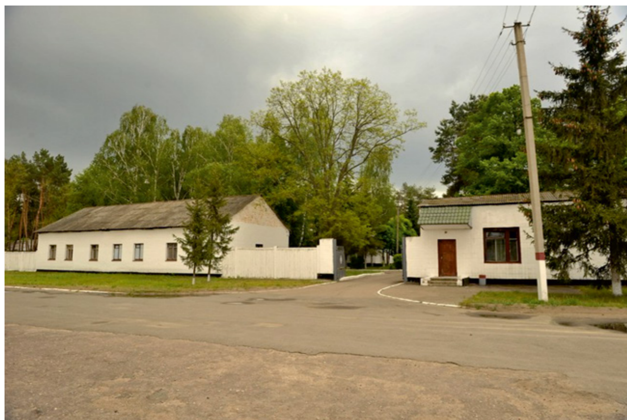
Контроль-пропускной пункт военного городка.

Суммарно из четырёх лет обучения каждый курсант провёл на полигоне один год - одна неделя из каждого месяца обучения отводилась на полевые занятия.