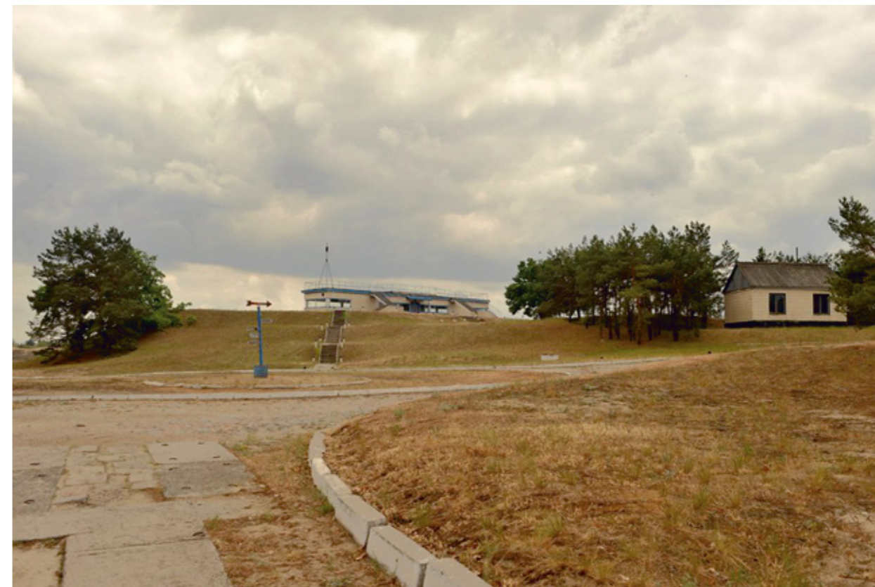
Сверху - въезд на высоту «Командную». Высота 120,5. Снизу - макет тактического поля, вид на тактическое поле.