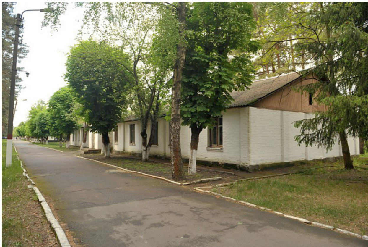
Сверху - курсантская казарма. Снизу - казарма внутри.