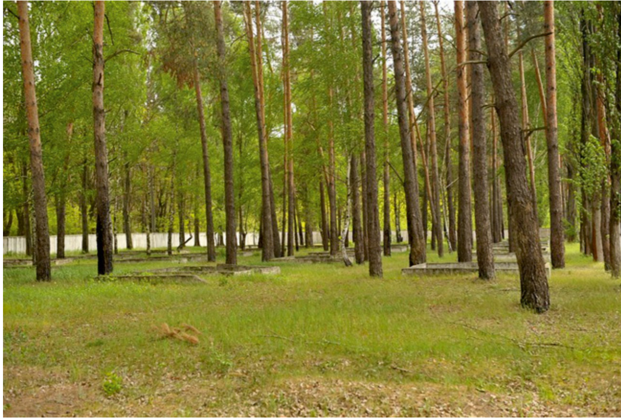
Сверху - место под палаточный лагерь. Снизу - дорога от спортгородка до курсантских казарм, справа видна летняя столовая.

Этим полигоном также пользовалось Киевское суворовское училище, осуществляя летние месячные полевые выезды для своих воспитанников. Суворовцы жили в оборудованном палаточном лагере возле спортивного городка, а питались в летней столовой.