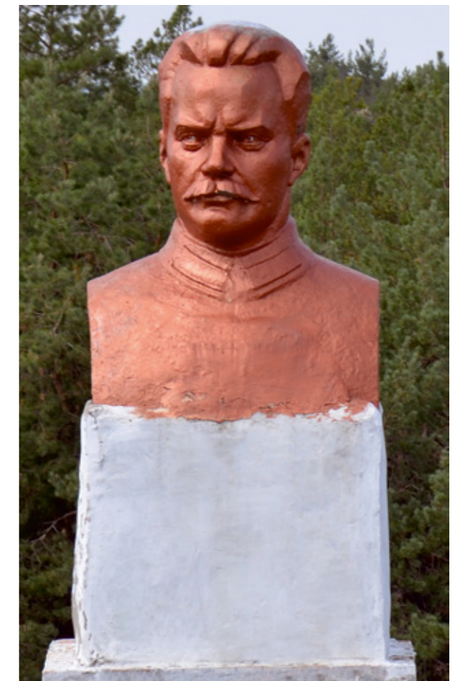
Бюст на высоте «Командной» на тактическом поле.