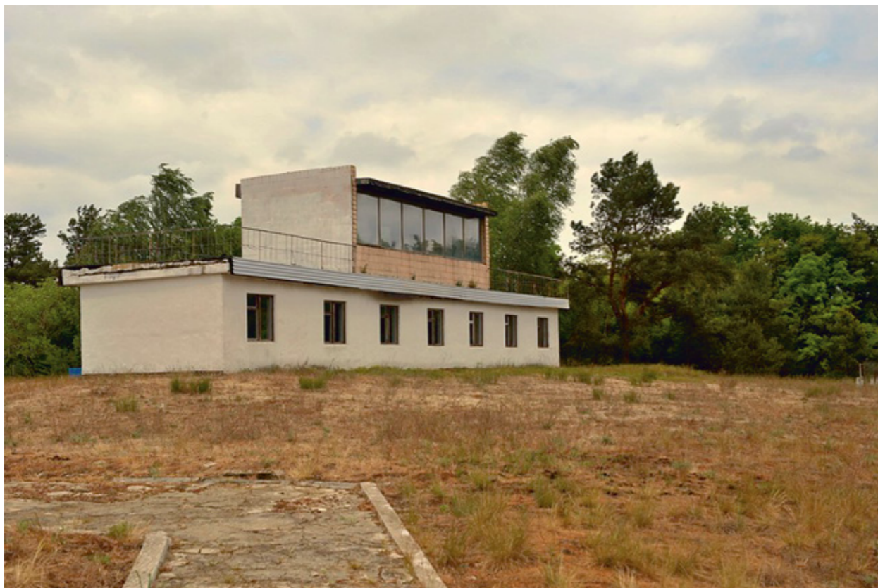
Сверху - старая вышка танкодрома. Снизу - эстакада для безопасной посадки в боевые машины.