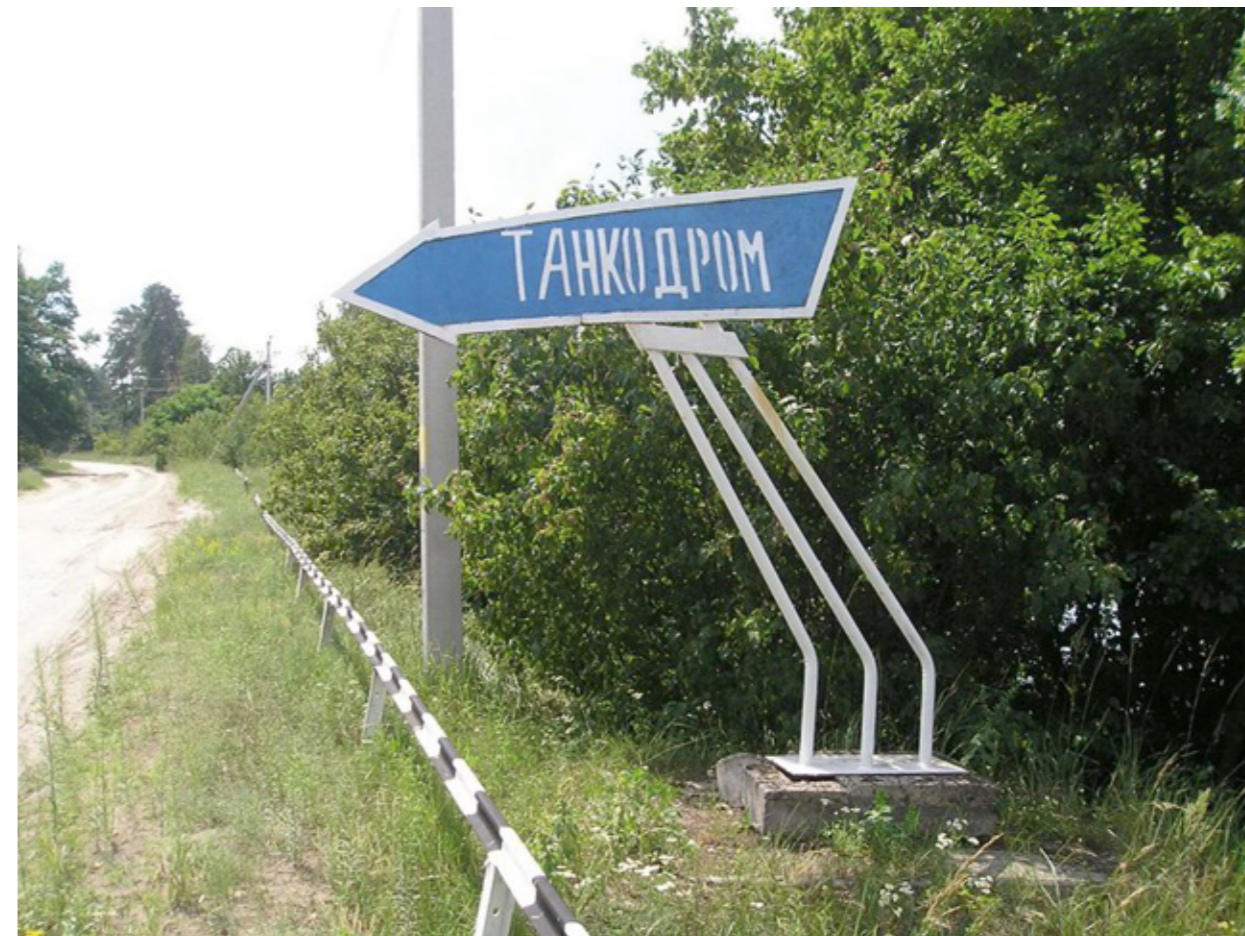
Сверху - указатель на танкодром. Снизу - вид на БМП на постаменте и главную вышку танкодрома.